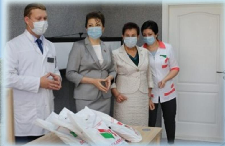
Подари праздник первокласснику