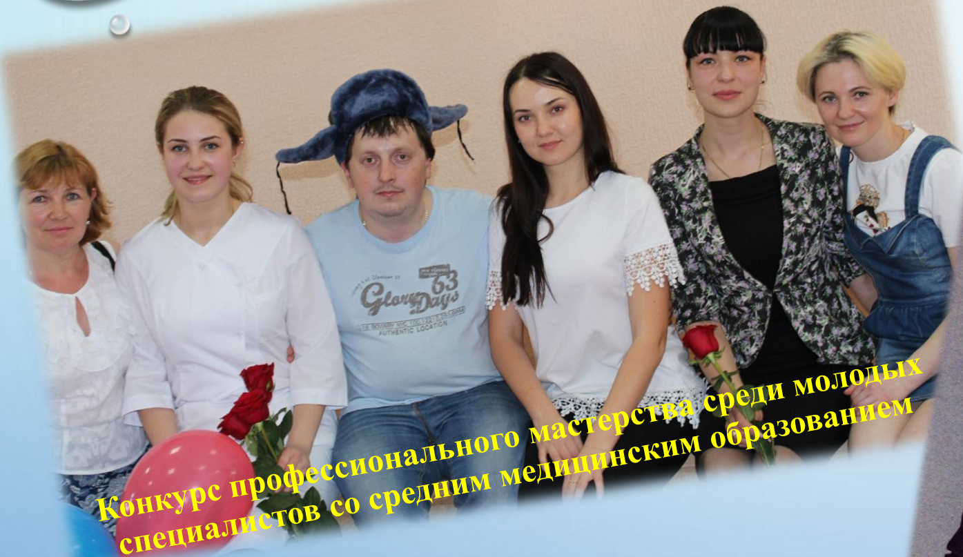
Конкурс профессионального мастерства среди молодых специалистов со средним медицинским образованием