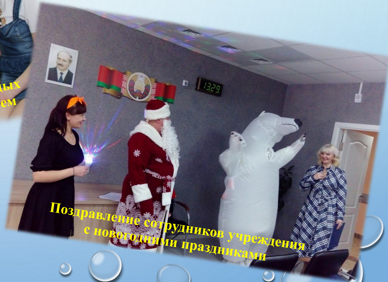
Поздравление сотрудников учреждения с новогодними праздниками