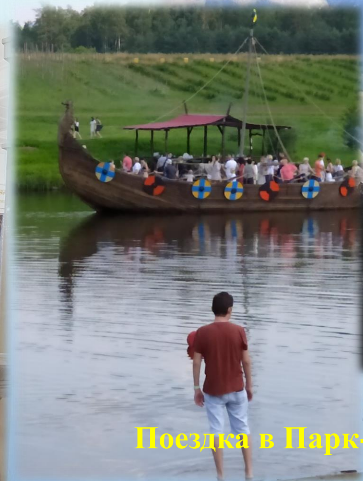
Поездка в Парк-музей Интерактивной Истории «Судя»