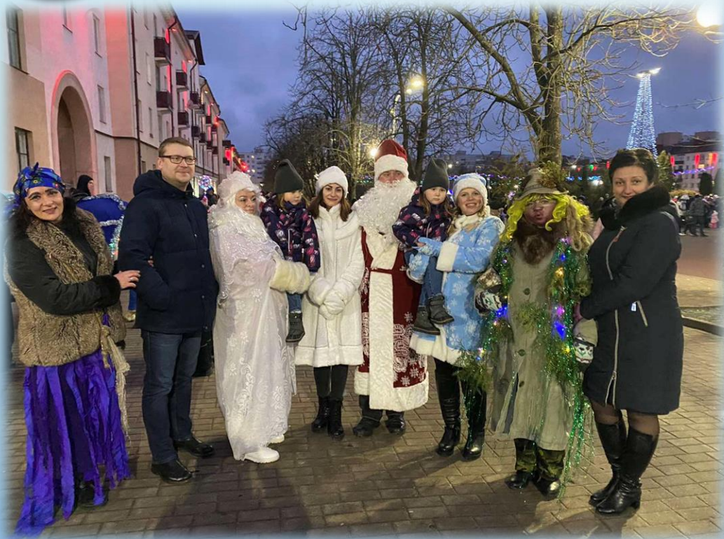
Шествие Дедов Морозов