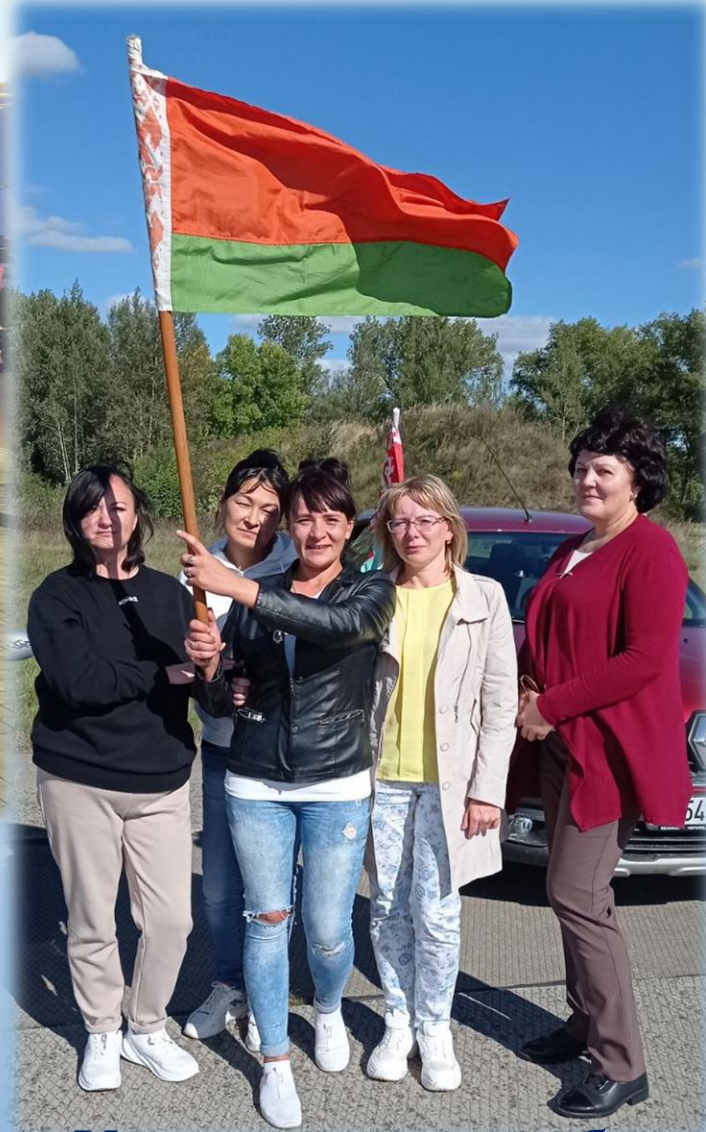
Участие в автопробеге День Народного Единства