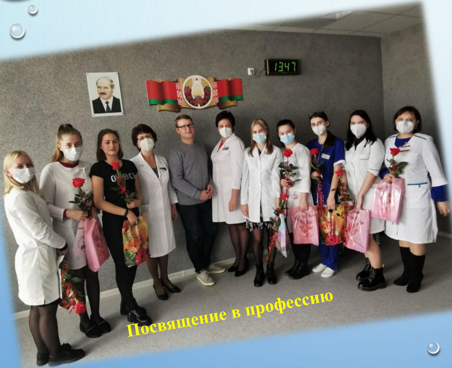
Посвящение в профессию