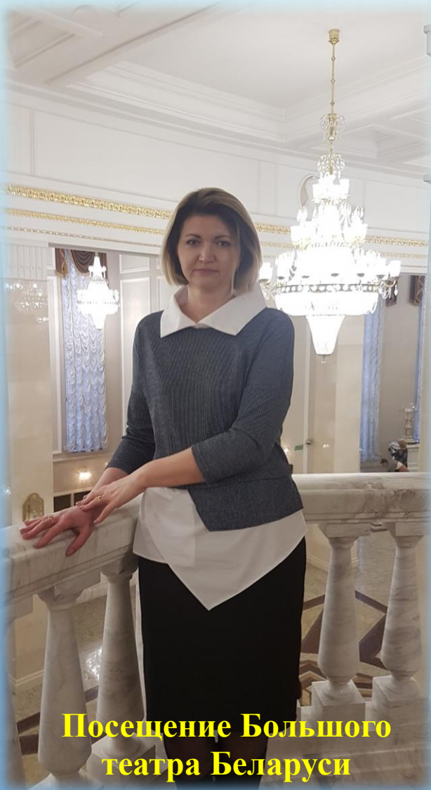
Посещение Большого театра Беларуси