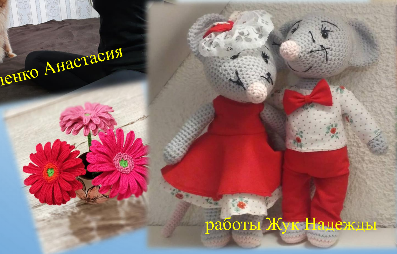
работы Жук Надежды